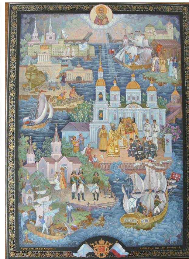
Проект в цвете