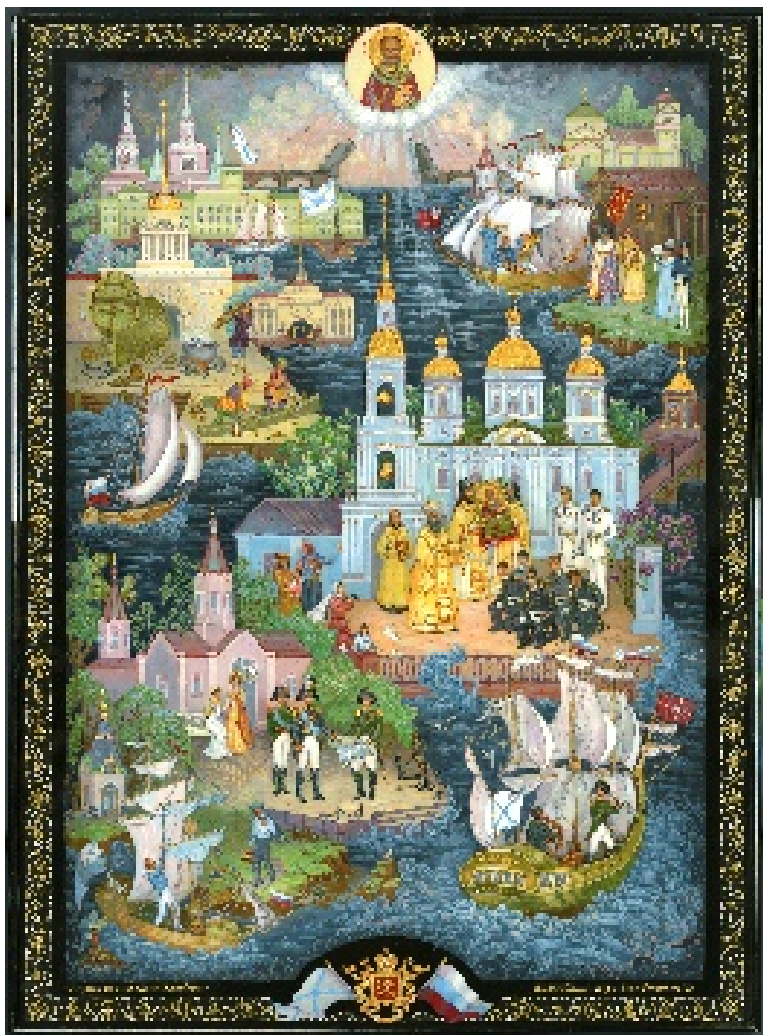
Проект выполненный в материале (на пластине из папье-маше)