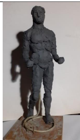
2.4.2. Анатомическая фигура