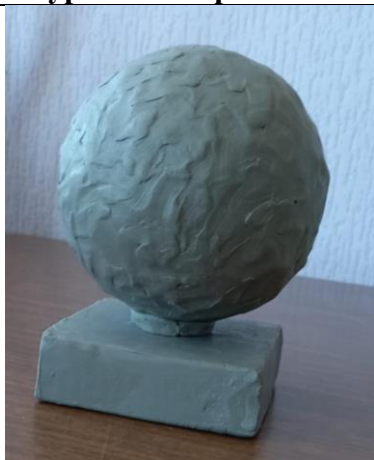
Тема 1.2.Лепка отдельного геометрического тела