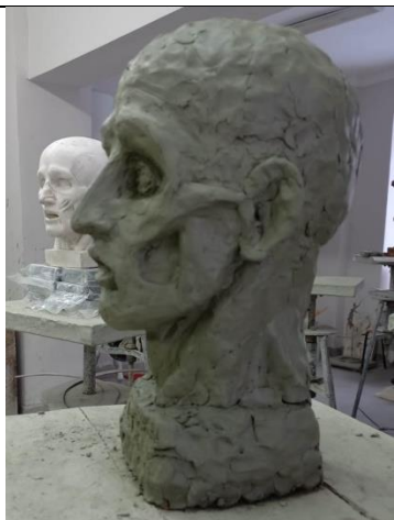
2.4.1 Анатомическая голова