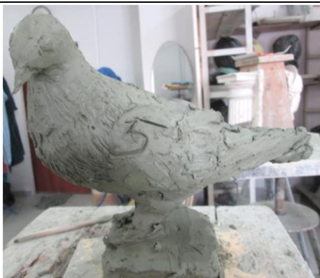
Тема 2.2.Пластическое изображение птиц.