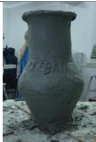
Тема 1.3.Лепка предметов быта