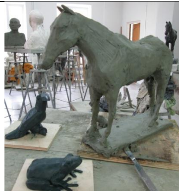
Тема 2.3.Пластическое изображение животного.