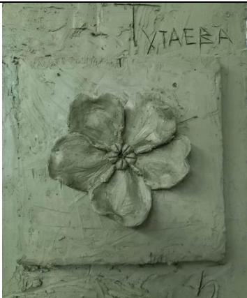
Тема 1.6 Скульптурное изображение цветка (растения) с натуры