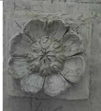
Тема 1.5.Копия гипсовой розетки или рельефа