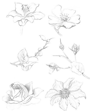
№1 Линейные зарисовки растений