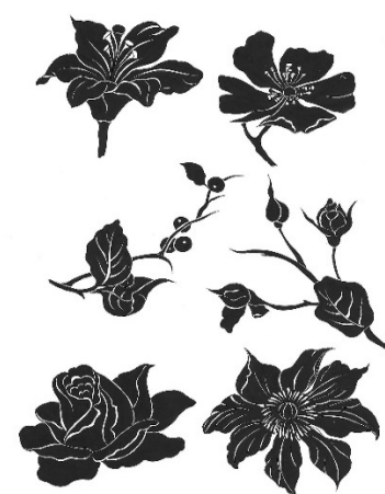
№3 Орнаментальное решение растений с выполненных зарисовок