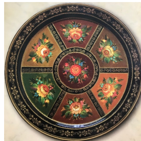
№3 Копирование росписи со сложными приемами декорирования