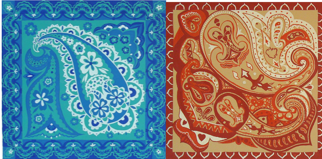
№ 2. Асимметричная композиция в квадрате (35х35см.) в цвете на планшете. Вариант 1.