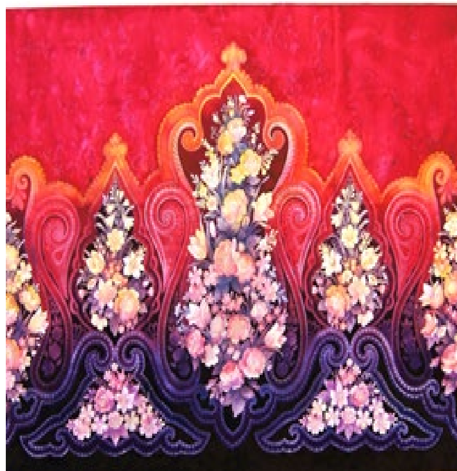
№ 6. Проект композиции росписи купона одежды, размер 110х110см. с демонстрацией на моделях, на разных изделиях (шарф, платье, юбка)