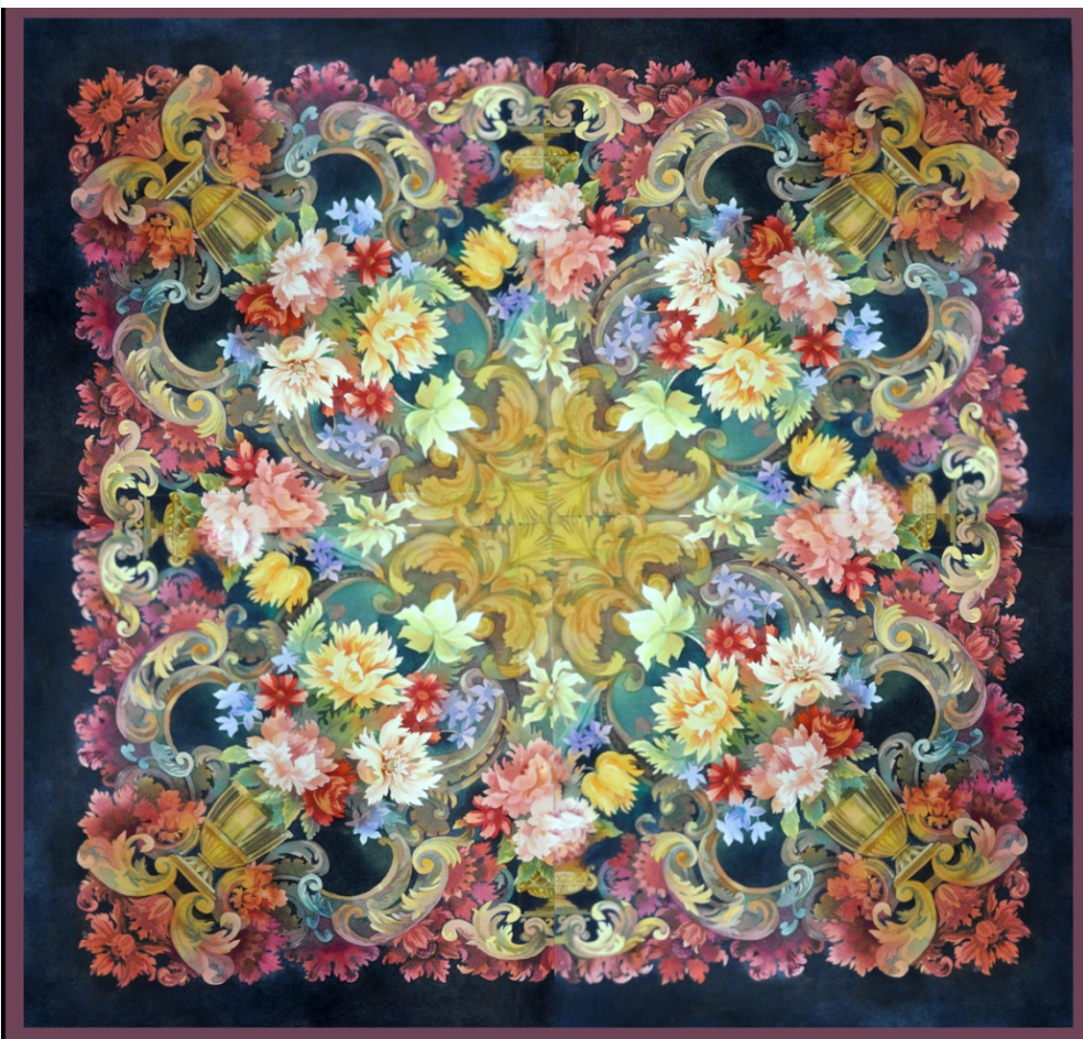
№ 7. Вариант 2. Проект композиции шали 140x140см.. и проект моделей применения изделия – планшет 40x60см.