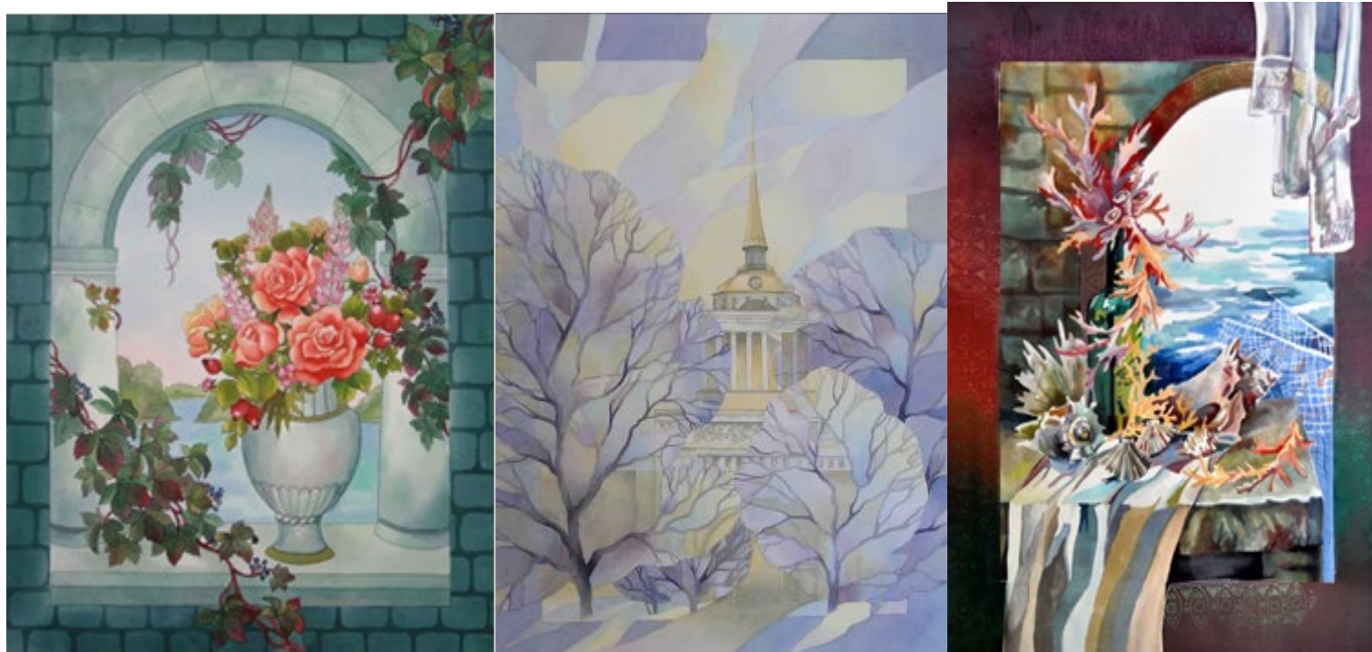
№ 8. Проект композиции росписи панно, размер 60x80см. (или серии панно)