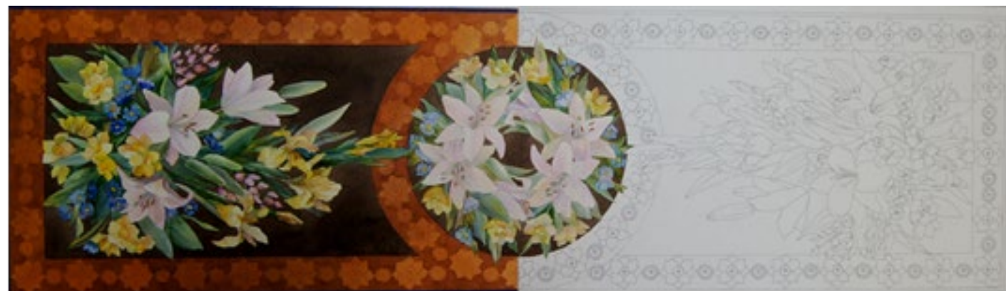
№ 3. Проект композиции симметричного шарфа, размер 45x150см. на планшете \frac{1}{2} в цвете, \frac{1}{2} в графике, (черной линией одной толщины).