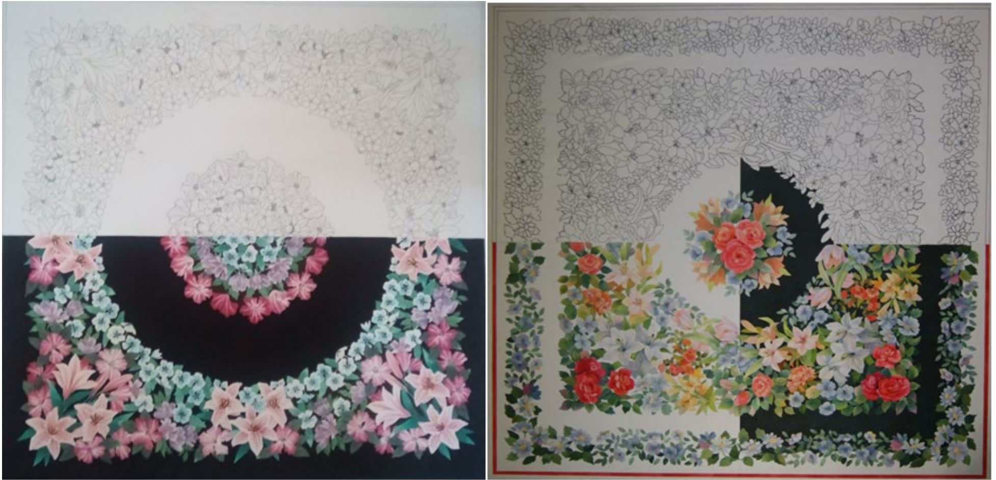
№ 4. Проект композиции традиционного платка, размер 90x90см. на планшете \frac{1}{2} в цвете, \frac{1}{2} в графике, (черной линией одной толщины).