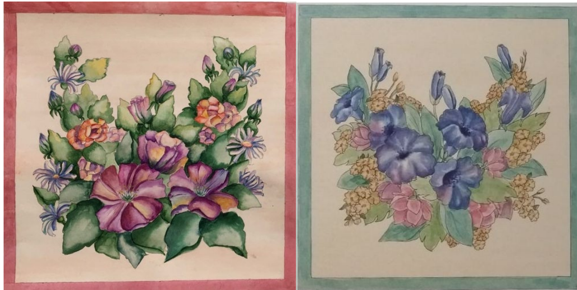
№ 2. Асимметричная композиция в квадрате (35х35см.) в цвете на планшете. Вариант 2.