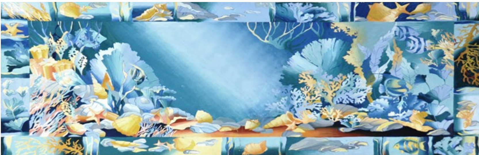
№ 7. Вариант 1. Проект композиции палантина, размер 60x190см. и проект моделей применения изделия – планшет 40x60см