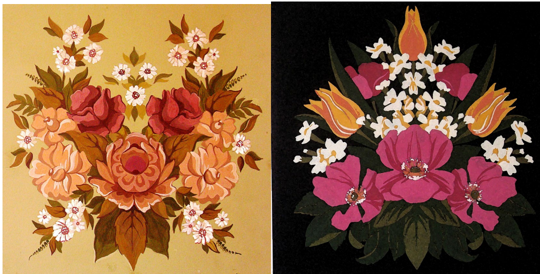
№ 1. Симметричная композиция в квадрате (35х35см.) в цвете на планшете. Вариант 1.