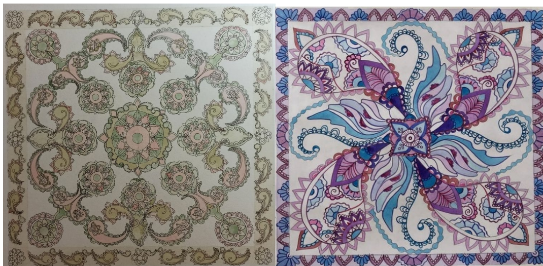
№ 1. Симметричная композиция в квадрате (35х35см.) в цвете на планшете. Вариант 2.